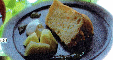
クラウンメロン soufflé ケーキ ¥500