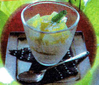
クラウンメロン バナナコッタ ¥500