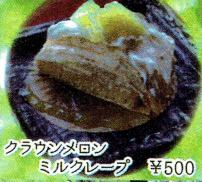
クラウンメロン ミルクレープ ¥500